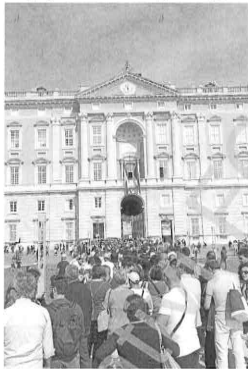
L'affluenza. Le code di turisti nella prima domenica gratuita di ottobre