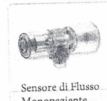
Sensore di Flusso Monopaziente

I prodotti di cui alle presenti schede tecniche sono idonei per la ventilazione invasiva neonatale