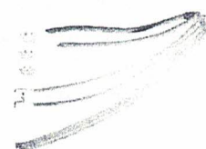
SLE1000 nCPAP Generator

I prodotti esposti nelle presenti schede tecnico sono idonei per la ventilazione Niv neonatale 9/07/2018