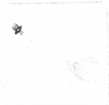
Tester di tenuta