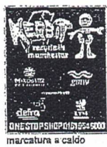
marcatura a caldo