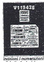
incisioni / numerazioni etichette / adesivi