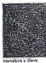
marcatura a rilievo