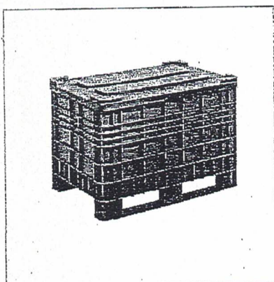
con traverse e coperchio

Disponibile con 4 piedi, con 2 traverse o con ruote.