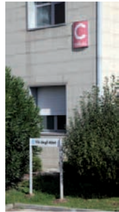
Targa identificativa di edificio