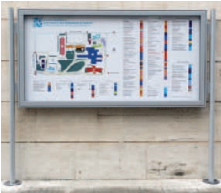
Bacheca con mappa dell'area ospedaliera e tabella/elenco delle strutture