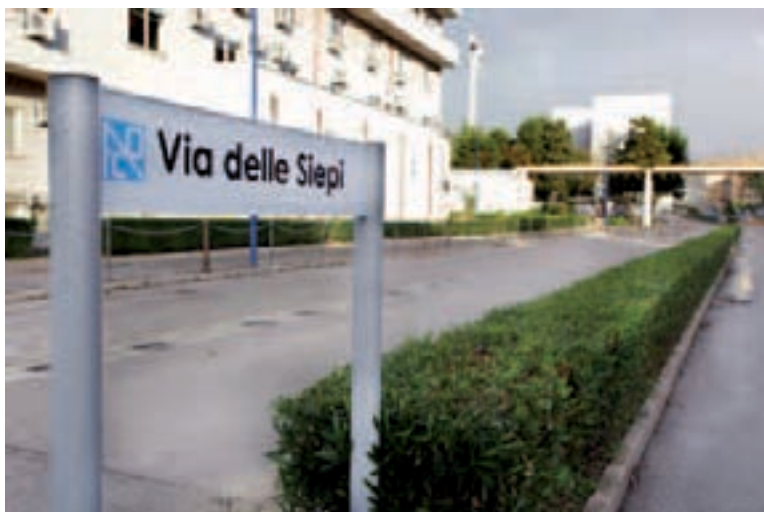
Targa di toponomastica