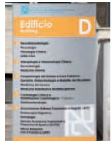
Totem ripiegativo di edificio