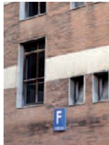
Targa identificativa di edificio