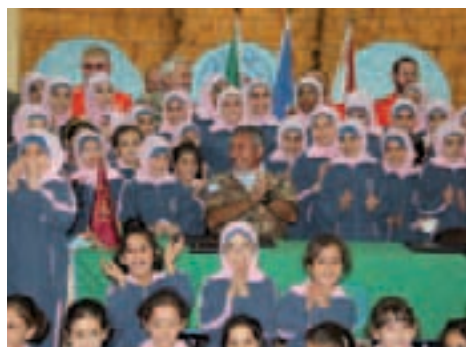
(ottobre 2010 - comunicato stampa della Cellula Pubblica Informazione del Sector West di UNIFIL e portavoce del Contingente Italiano).

forma di partenariato è nata tra il Comando della Brigata "GARIBALDI" ed il direttore aziendale dell'Ospedale, ancor prima della partenza dell'Unità per il Paese dei Cedri, allorché fu ravvisata la necessità di intervenire in un settore che, in questa parte del Libano, è particolarmente precario.