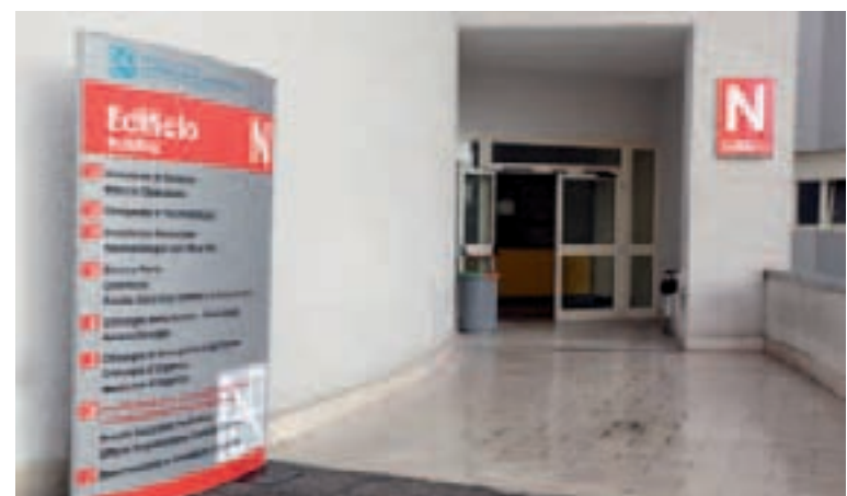
Totem ripiegativo di edificio