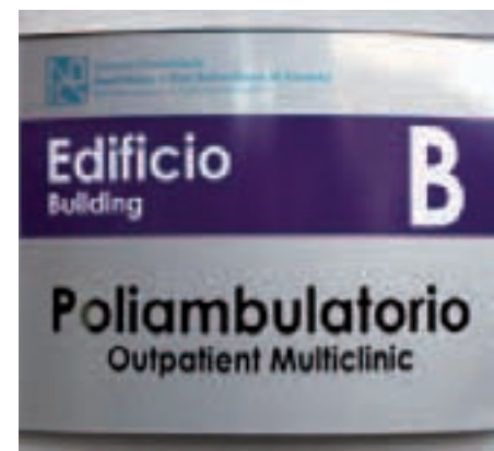
Targa di struttura con traduzione in lingua inglese