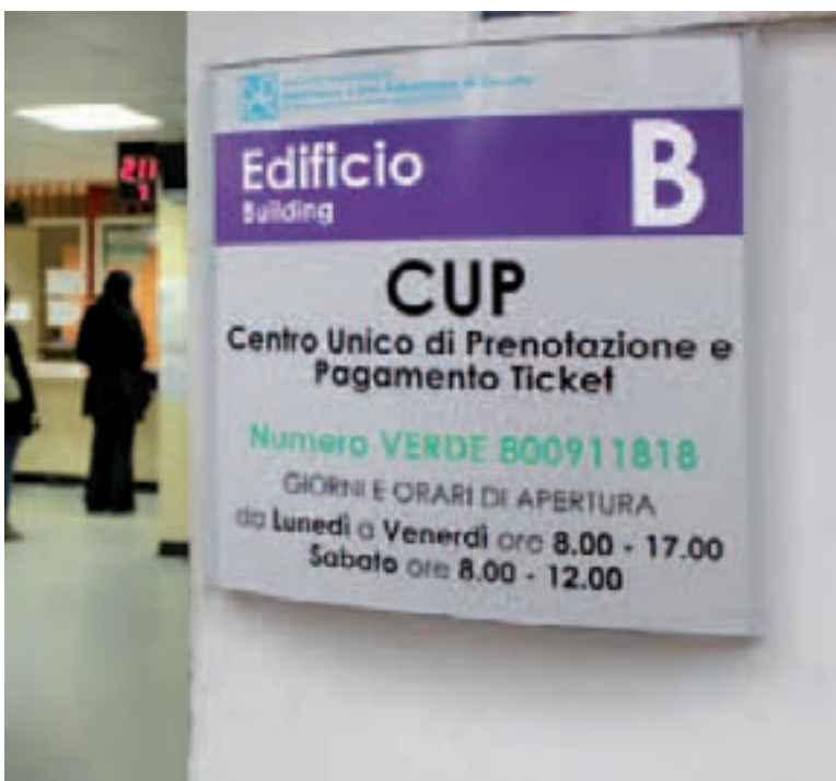
Targa di struttura con giorni e orari di apertura