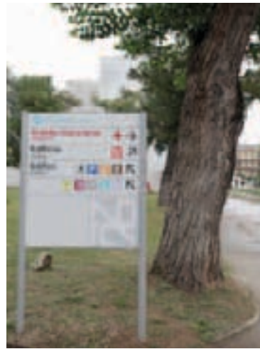
Pannello di smistamento