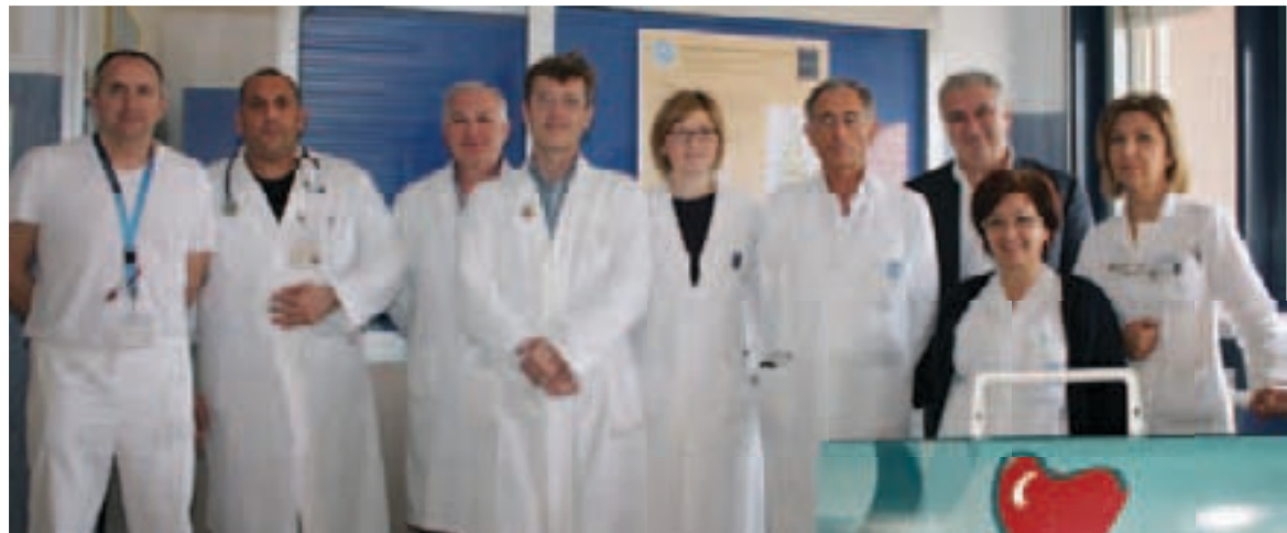
L'equipe dell'Unità Operativa Complessa di Cardiologia Clinica e Riabilitazione Cardiologica

In Italia in media c'è un centro di riabilitazione cardiologica ogni 300 mila abitanti, così ripartiti: al nord una struttura ogni 250 mila, al cen-