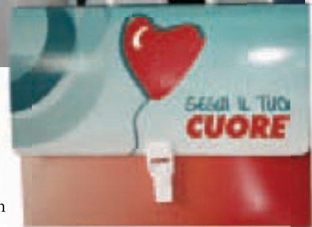
Il kit informativo per il paziente dimesso

Sideri, Donato Soviero, fornisce al paziente un kit completo con le indicazioni da seguire. Un percorso di riabilitazione cardiologica ottimale comprende diverse attività, di cui le principali sono: l'esercizio fisico mirato, la correzione dello stile di vita, ad esempio attraverso la scelta di una nuova e corretta alimentazione, la stratificazione del rischio mediante la diagnostica cardiologica più avanzata, l'intervento sui fattori di rischio (al primo posto, il fumo), la programmazione di un adeguato follow up e il supporto psicologico necessario al paziente per