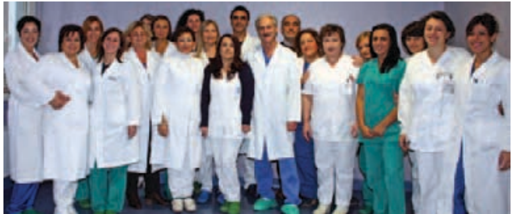
L'equipe di Ginecologia

Grazie al coinvolgimento multidisciplinare si garantisce la gestione diretta della donna a 360 gradi per affrontare le problematiche della menopausa, sterilità/infertilità, patologia benigna della sfera genitale, passando attraverso percorsi diagnostici-terapeutici dedicati alle malattie sessualmente trasmesse e patologia preneoplastica e neoplastica del basso tratto genitale femminile e maschile, alla patologia endometriale a quella della mammella, fino al coinvolgimento di esperti chirurghi per affrontare le problematiche neoplastiche multi organo (come sempre più spesso accade nella patologia oncologica, soprattutto ovarica).