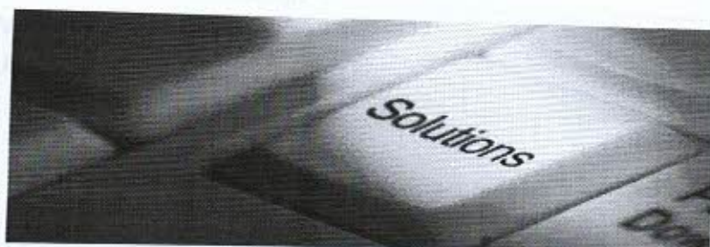
PETRIS SISTEMI: Soluzioni per gestire tempo e lavoro

Petris Sistemi propone, con pluriennale esperienza, prodotti e soluzioni nel settore dei sistemi raccolta dati e identificazione automatica del personale, che trovano applicazione nella rilevazione presenze, controllo accessi, monitoraggio produzione e nei sistemi per la visualizzazione di data/ora e dell'informazione multimediale al pubblico.