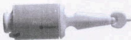
Purilon® Gel Barriera: Idrogel